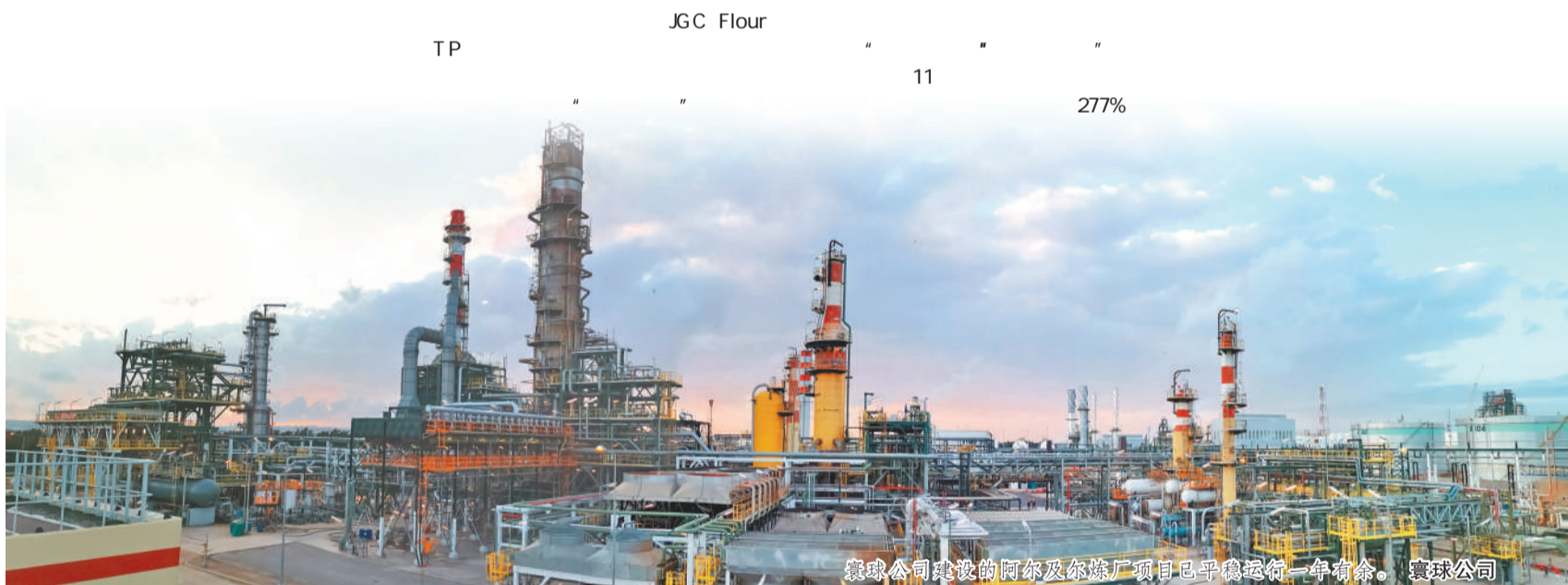
寰球公司建设的阿尔及尔炼油厂项目已平稳运行一年有余。寰球公司